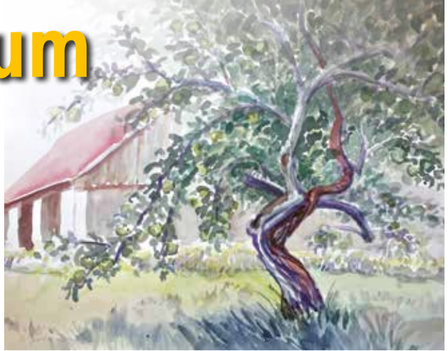
Aquarell: Rosi Grifeder-Bednarik, 2020

Zwischen den beiden saß die kleine Emma, fünf Jahre alt, und schleckte an einem Erdbeereis. Sie sah weder die Melancholie des Alters noch die Gefahr für die Verkehrssicherheit. Sie sah nach oben und rief begeistert: „Guck mal, Papa! Der Baum hat einen Arm, der genau aussieht wie eine Rutsche für Eichhörnchen. Und da oben wohnt bestimmt eine Fee, die sich hinter dem großen Blatt versteckt!“